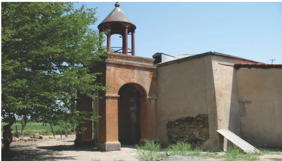
Նկար 1. Դիմիտրով գյուղի «Սբ. Մարիամ Աստվածածին» եկեղեցին հարավ արևմտյան կողմից

Ըստ ՀՀ Կառավարության 24 հունվարի 2002 թվականի «ՀՀ Արարատի մարզի պատմության և մշակույթի անշարժ հուշարձանների պետական ցուցակը հաստատելու մասին» N 65 որոշման Դիմիտրով գյուղի «Սբ. Աստվածածին» եկեղեցին գտնվում է գյուղի հարավ արևմտյան եզրին, կառուցվել է 1868 թվականին, հանդիսանում է տեղական նշանակության հուշարձան և ունի պետ. ցուցիչ՝ (3.38.1) [2]: