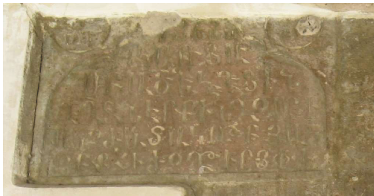
Նկար 3. «Սբ. Աստվածածին» եկեղեցու հարավային մուտքի արձանագրությունը

Ըստ Արարատյան Հայրապետական թեմի կողմից հրապարակված վիմագրագետ՝ Հայկ Հակոբյանի կողմից վերծանված, «Դմիրտրովի «Սբ. Աստվածածին» եկեղեցու արձանագրությունների. առաջին» արձանագրության մեջ ասվում է. «Տ(է)ր ա(ստուա)ծ Յ(իսու)ս Ք(րիստո)ս. /186- ամ(ի) / կառուցաւ / Ս(ուր)բ Ա(ստուա)ծ(ածի)ն եկեղեցին / գէղջ Նէրքին Ղոյլասարի, / ա(մենայ)ն օժանտակութեամբ Յակ/օբ ք(ա)հ(անայ)ի, ժող(ովր)թի ի(ւ)ր(ոյ), փ(ետրուարի) 1: