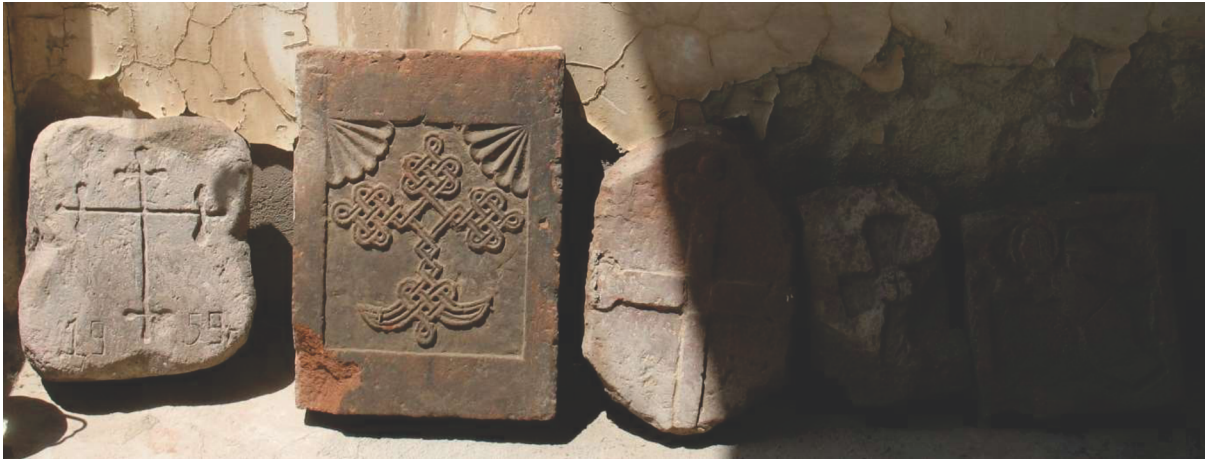
Նկար 5. «Սբ. Մարիամ Աստվածածին» եկեղեցու հարավային մուտքի մոտ առկա սալերը

Հարավային մուտքի մոտ առկա է տանիքաձևով բաց նախասրահ, որի արևմտյան կողմում հուշարձանի զննության օրվա դրությամբ առկա էին 5 քարասալեր՝ «1959թ.» արձանագրությամբ և խաչակող, անհավասարակողմ խաչով քարասալ, կարմիր տուֆով հյուսկեն խաչային հորինվածքով քարասալ, հողմահարված կարմիր տուֆով խաչային հորինվածքով սալ, պայմանական բյուզանդական խաչ համարվող կենտրոնական խաչի մեղալիոնով քարասալ, հրեշտակի պատկերաքանդակ: