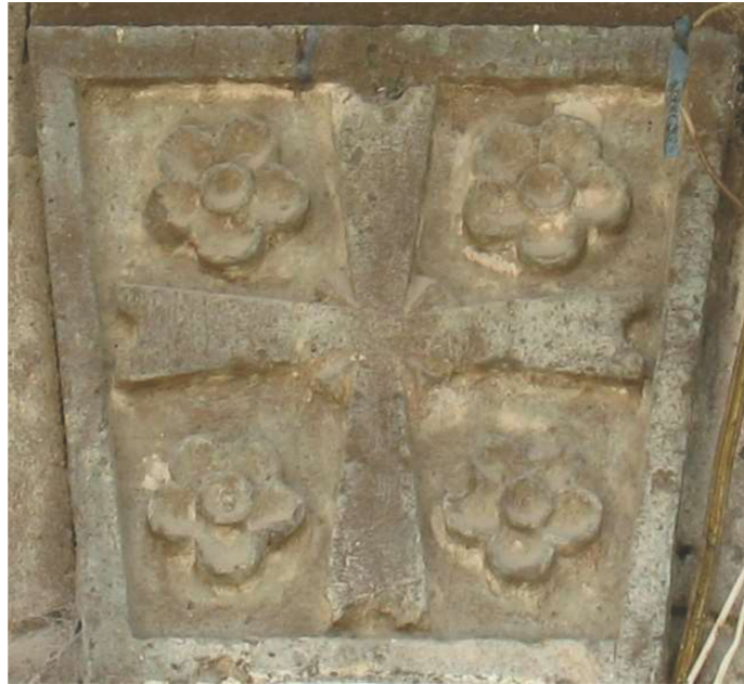
Նկար 2. «Սբ. Աստվածածին» եկեղեցու հարավային մուտքի խաչաքանդակը

ներկայացնում է սեղանաձև շրջանակի մեջ առնված հավասարակողմ Մալթական համարվող, ութագագաթ տիպի խաչի պատկեր, որի թևերն ավարտվում են երկու սրանկյուն գագաթներով, խաչի չորս կողմերում առկա է ծաղիկների ոչ արհեստավարժ կերպով պատկերում: