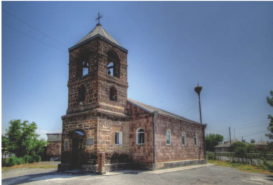
Նկար 7. Դմիտրովի «Սուրբ Կիրիլ» եկեղեցին 1840թ.

Դմիտրովի «Սուրբ Կիրիլ» եկեղեցին, 1840թ.) ճարտարապետությունը և ներքին հորինվածքը, նաև կատարելով համեմատական վերլուծություն Դմիտրով գյուղի «Սբ. Աստվածածին» եկեղեցու հետ՝ պարզ է դառնում, որ ընդհանուր հուշարձանն իր արձանագրություններով և ճարտարապետական առանձնահատկություններով հարում է հայկական գյուղական բազիլիկ եկեղեցիների հորինվածքներին և աղերսներ չունի Հայաստանում ասորական քրիստոնեական տաճարների ընդհանուր հորինվածքային առանձնահատկությունների հետ: