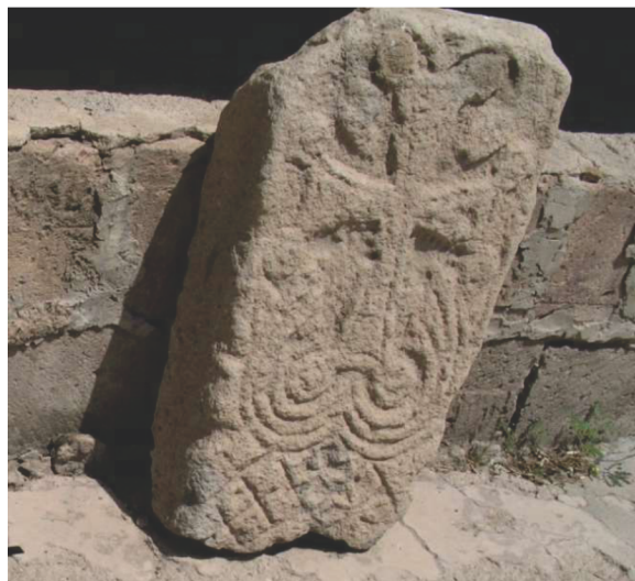
Նկար 6. «Սբ. Մարիամ Աստվածածին» եկեղեցու հարավային մուտքի մոտ առկա խաչքար

Նախասրահի դրսի ցածր պատին առկա էր հենած մի խաչքարային հորինվածքով սալ, որի կենտրոնական հատվածում առկա է հայկական արվեստում լայն տարածում գտած ծաղկաձ խաչի պատկեր, որի հիմքում արմավի տերևներ են: